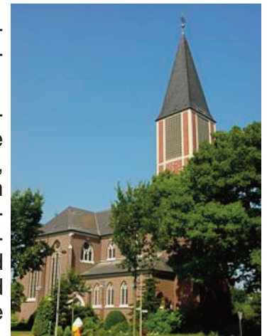
Das Wahrzeichen von Karken - die Kirche

In Karken selbst gibt es 2 Supermärkte (Penny und Norma), eine Metzgerei, einen Bäcker, eine Frittenbude und eine ganz hervorragende Pizzeria - Il Genio (Roermonder Str. nahe ESSO-Tankstelle).