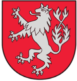
Wappen der Stadt Heinsberg

Von daher also jetzt Heinsberg-Karken. Karken hat zur Zeit etwa 4.000 Einwohner, die gesamte Stadt Heinsberg etwa 40.000 Einwohner.